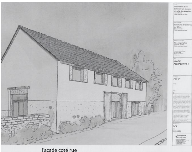
Façade coté rue

Aussi, et en dialogue avec la commune de Salornay-sur-Guye qui avait un projet immobilier de réhabilitation d'un ancien bâtiment en cœur de ville, il a été convenu que des espaces pourraient être réservés pour les équipes de la Communauté de communes dans le cadre de ces travaux.