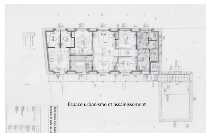
Espace urbanisme et assainissement

Les travaux de réhabilitation du bâtiment dit de « la grange aux diligences », portés par la commune de Salornay, sont en passe de se terminer et les équipes de l'assainissement comme de l'instruction du droit des sols devraient pouvoir emménager dans leurs locaux au mois de septembre prochain.